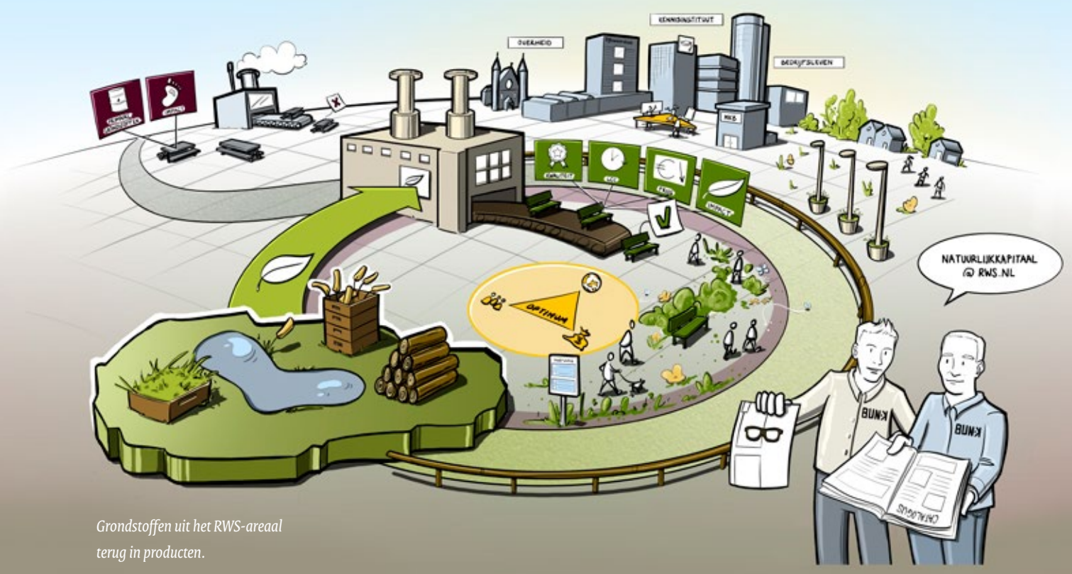
Grondstoffen uit het RWS-areaal terug in producten.